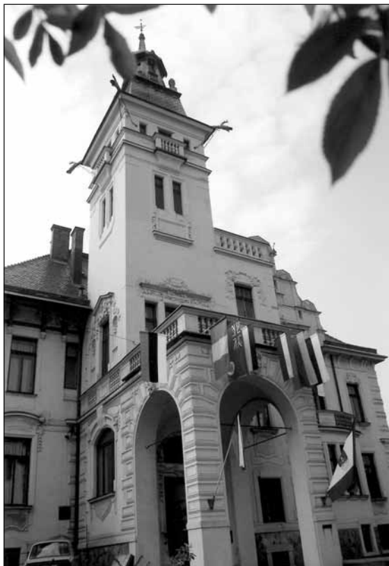
Heranova violoncellová soutěž nacházela po mnoho let útočiště v budově Hernychovy vily, kde až do roku 2003 sídlila Základní umělecká škola Jaroslava Kociana

Rok 2003 se stal významným mezníkem Heranovy i Kocianovy soutěže. V tomto roce byla předána do užívání nová moderní budova Základní umělecké školy Jaroslava Kociana, ve které se obě soutěže konají. HVS byla první větší akcí od zahájení provozu a jakousi předpremiérou jubilejního ročníku KHS.