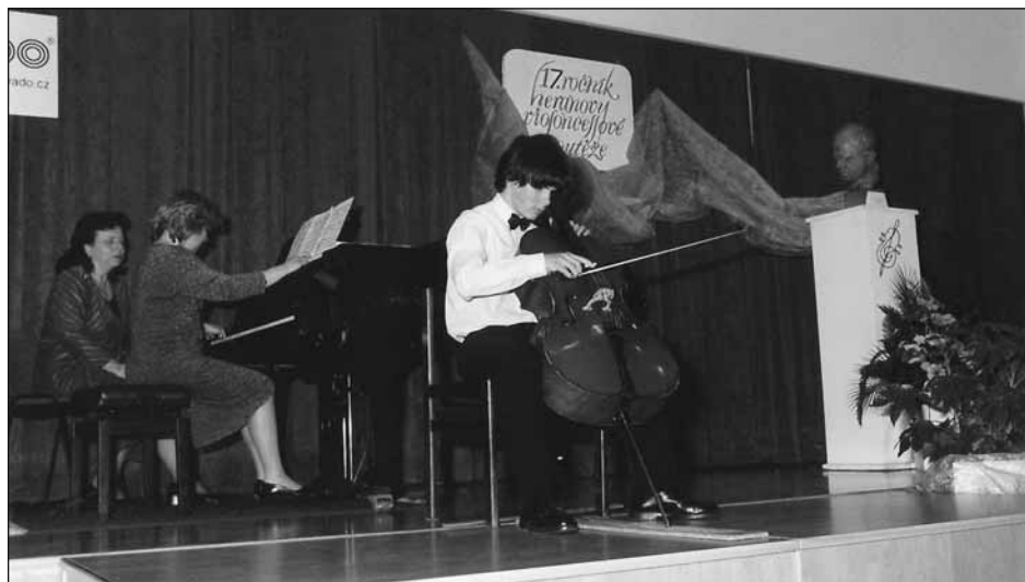
Z průběhu soutěže v nových prostorách sálu ZUŠ J. Kociana

Jak to vypadá, Heranova violoncellová soutěž žije dál a doufejme, že bude žít i v příštích letech. K tomu ovšem potřebuje nové violoncellové talenty nejen z Česka, ale i z celé Evropy a snad i světa. Heranova soutěž se na jejich rozvoji za téměř půl století své existence určitě výrazně podílela.