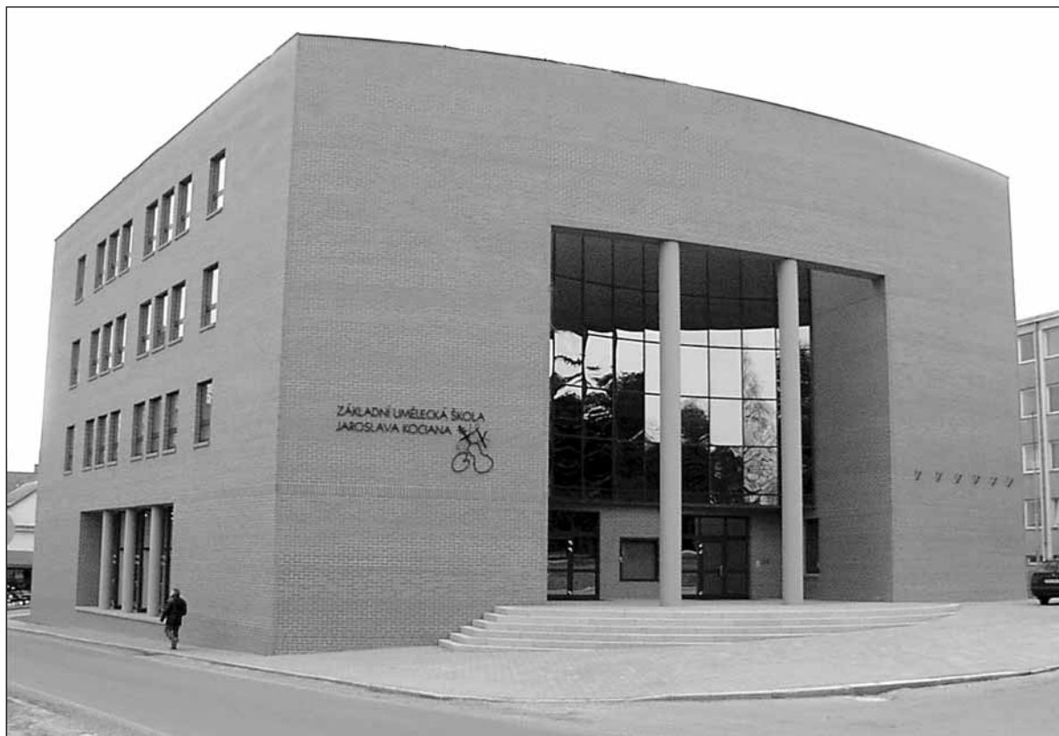
Moderní budova ZUŠ Jaroslava Kociana