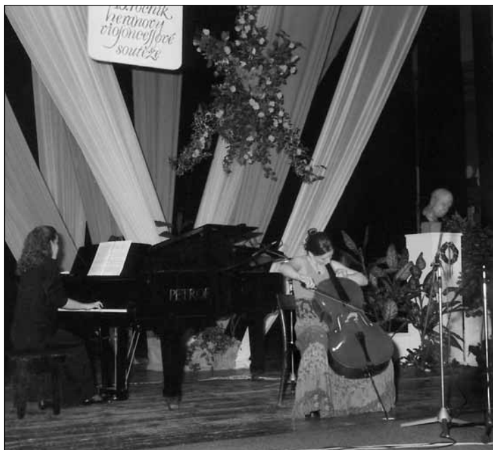
Dějištěm jubilejní patnácté HVS bylo Roškotovo divadlo