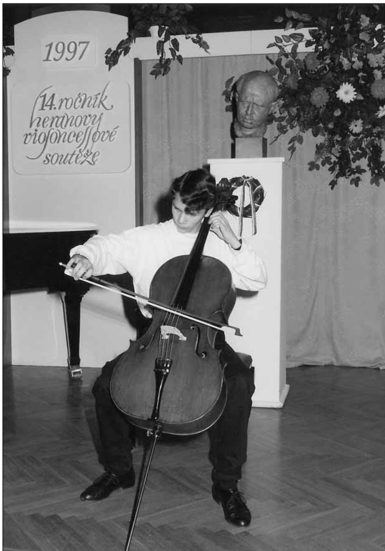
Absolutním vítězem a laureátem 14. HVS 1997 se stal vynikající cellista z Německa Claudius POPP